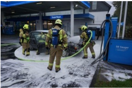
Brandbekämpfungsmaßnahmen unter schwerem Atemschutz und Einsatz von Löschschaum