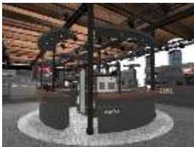
Foto 1: Stimmungsvoll und mit neuem Konzept präsentiert Miele dem Fachpublikum seine Produktinnovationen auf Gut Böckel. (Foto: Miele)

Download Text und Foto: www.miele-presse.de