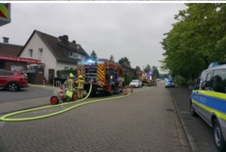
Blick auf die Straße