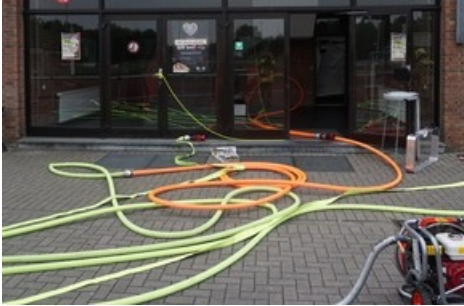
Blick auf die Zugangsmöglichkeit