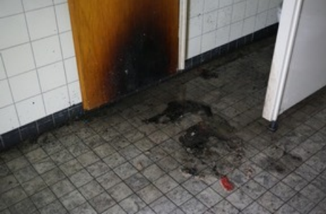
Schaden an einer Kabinentür