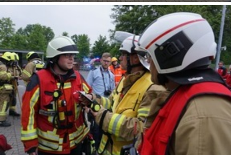
Abstimmung der Führungskräfte