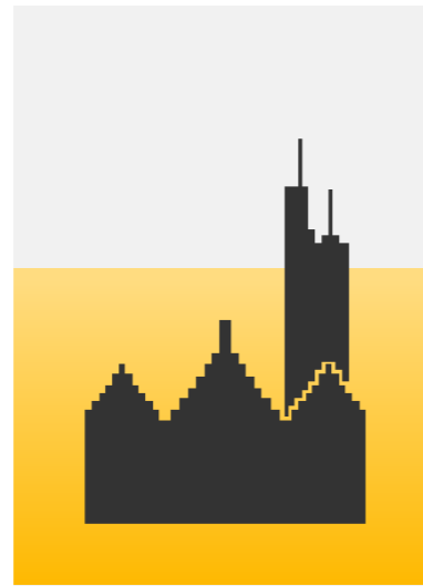
Frankfurt a. Main