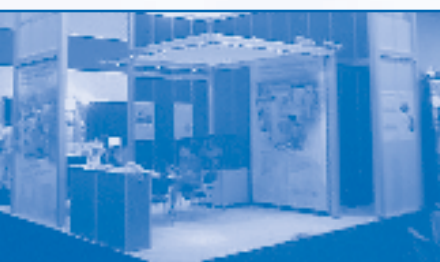
Stand der SINGULUS TECHNOLOGIES AG auf der Semicon West 2004, USA