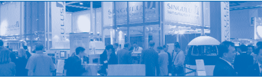
Großer Andrang am SINGULUS-Stand auf der Media-Tech Expo 2004