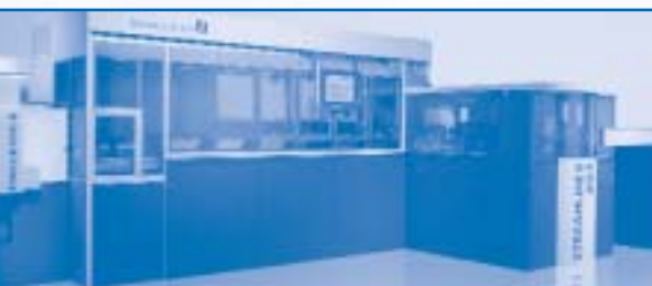
STREAMLINE II DVD-R DVD-R Beschichtungsanlage der 2. Generation

ergab sich mit 297,6 Mio. Euro ein um 31,9 % höherer Gesamtauftragseingang als im Vorjahr mit 225,6 Mio. Euro. Insbesondere der Auftragseingang bei DVD 9 mit 193 Replikationslinien, bei DVD-R mit 42 Replikationslinien und bei Mastering-Anlagen lag über den Planungen.