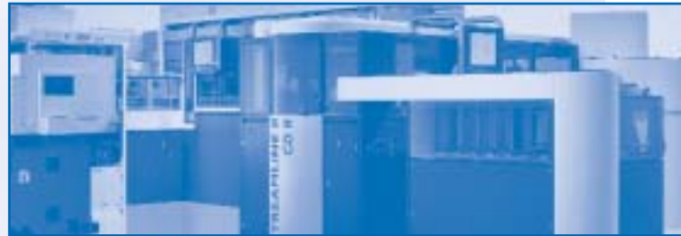
Neue STREAMLINE II Replikationslinie für CD-R

nach Europa und Asien ausgeliefert und haben den sogenannten Betatest (Vorserientest) erfolgreich bestanden. Mit der Serienproduktion der STREAMLINE II wurde bereits ab Mai dieses Jahres begonnen.