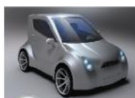
POWER PLAZA TEAM