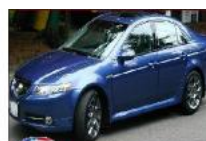
ZERO RACE SUPPORT

Für mehr Informationen siehe www.zero-race.com