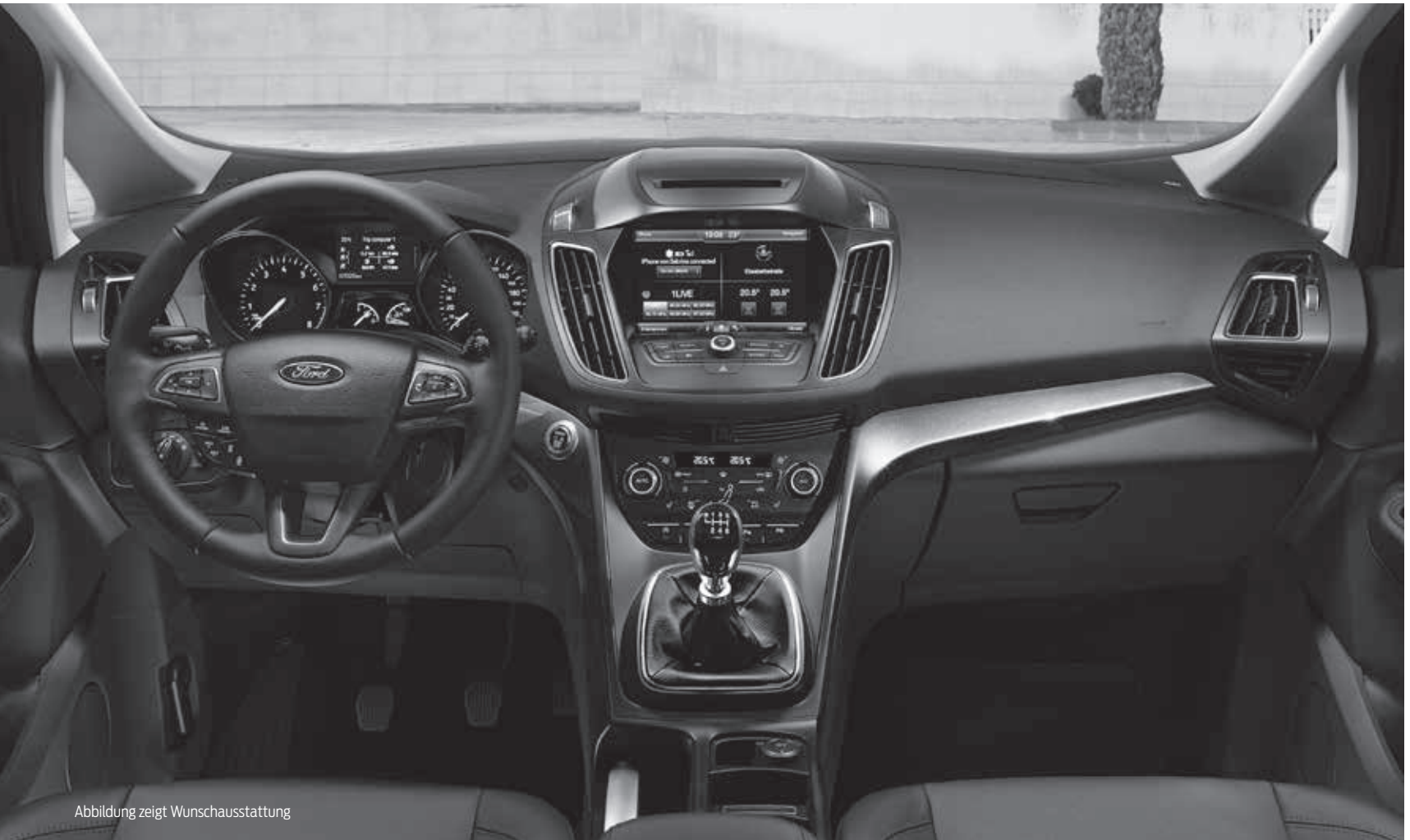
Abbildung zeigt Wunschausstattung