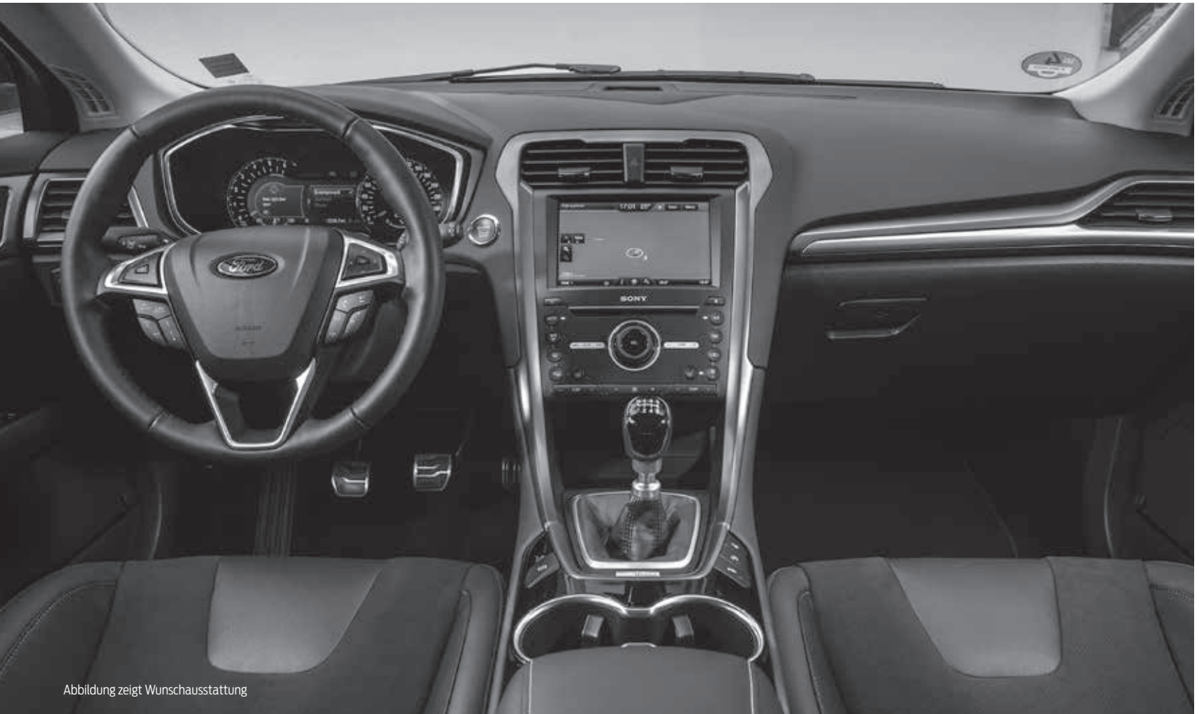
Abbildung zeigt Wunschausstattung